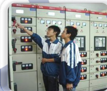
工厂电气设备运行与维护： 维修电工