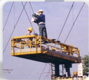
接触网运行检修与施工： 接触网工