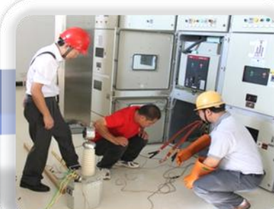
电气设备试验： 电气试验工