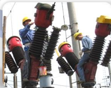
变配电所运行检修： 变电值班员