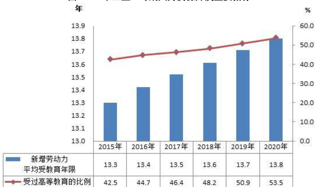
图 1 “十三五”时期人力资源开发主要指标

全国新增劳动力平均受教育年限 13.8 年，比上年提高 0.1 年，其中，受过高等教育比例达到 53.5%，比上年提高 2.6 个百分点。